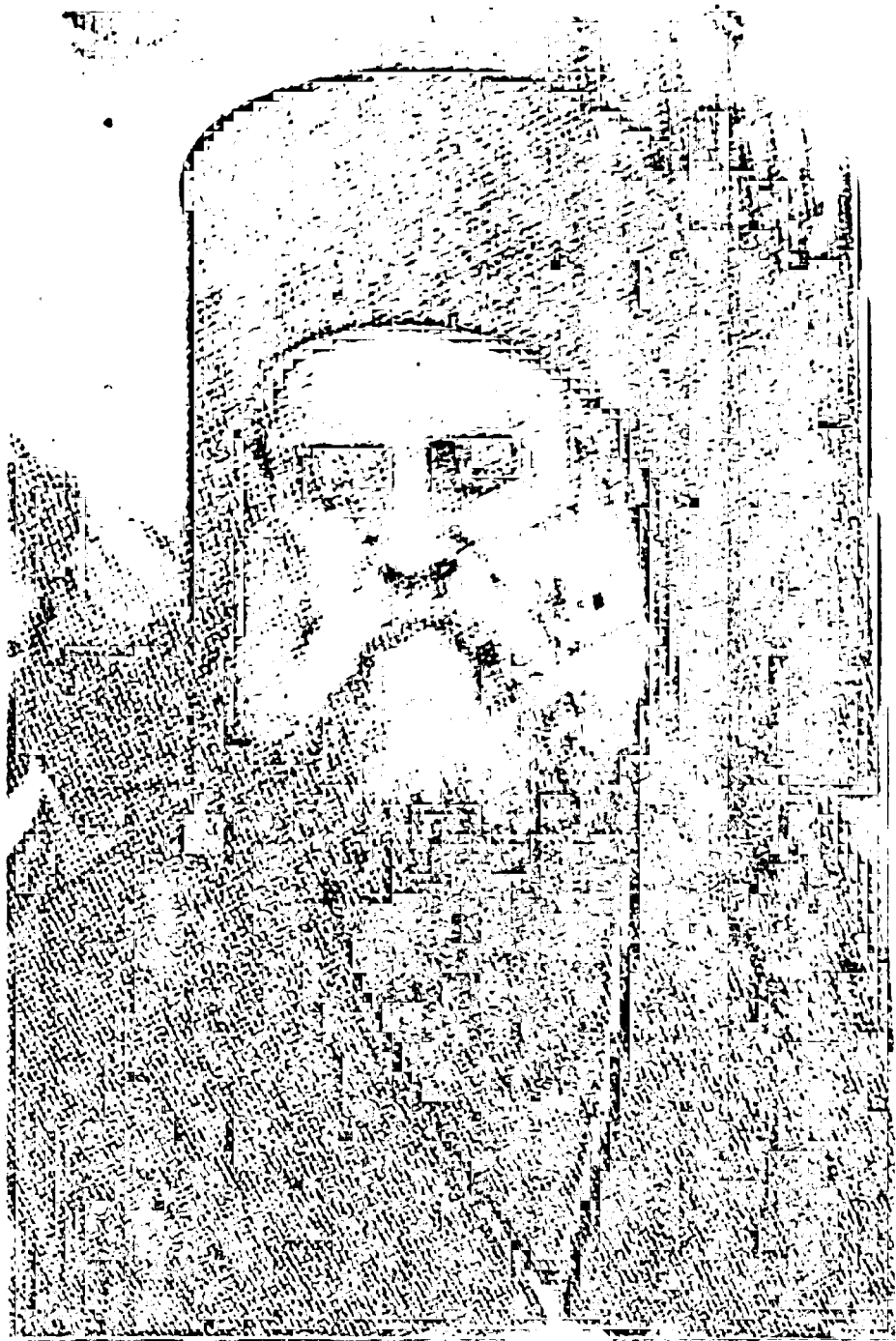
Ὁ Ἅγιος Νεκτᾶριος περὶ τὸ ἔτος 1900. (Λεπτομέρεια ἐκ τῆς γνωστῆς φωτογραφίας τοῦ Ἁγίου, πρὸ τοῦ Ἱ. Ναοῦ Ἁγ. Ἀθανασίου Κύμης, κατὰ τὴν διάρκειαν Ἐθνικῆς Ἐορτῆς).