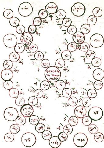
Εικόνα 1: ΒΚΨ 16/170, φ. 112v

του πλαγίου τετάρτου, τον αυτόν και τρίτον και μέσον δεύτερον· ώστε από μεν του τρίτου τριφωνία ποιήσας, ευρήσεις δεύτερον· από δε του μέσου δευτέρου, ήγουν του νέανες, ευρήσεις τρίτον τρεις φωνάς αριθμήσας».