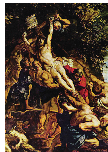
Rubens, Η Σταύρωση (περ. 1610-1611), χαρακτηριστικό δείγμα φλαμανδικού μπαρόκ

Μπαρόκ (Baroque). Με τον όρο αυτό αναφερόμαστε στον ρυθμό που αντικατέστησε την κλασική Αναγέννηση, σε μια περίοδο ραγδαίων κοινωνικών και πολιτικών αλλαγών. Ο ρυθμός μπαρόκ είναι ένας νέος καλλιτεχνικός τρόπος έκφρασης που ήκμασε από τα τέλη του 16 ου ως τα τέλη του 18 ου αι. στην αρχιτεκτονική, τη ζωγραφική, τη γλυπτική και τη μουσική. Δημιουργήθηκε αρχικά στη Ρώμη και από εκεί σταδιακά εξαπλώθηκε σε ολόκληρη την Ευρώ-