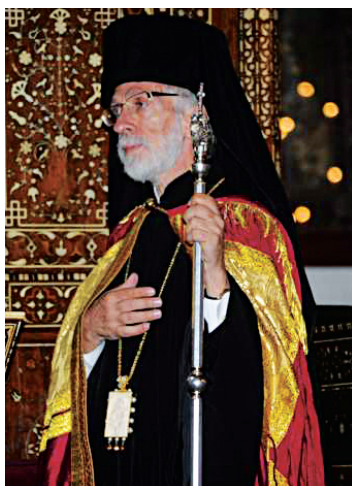
Μελίτων Καράς, μητρ. Φιλαδελφείας

Ιεράς Συνόδου του Οικουμενικού Πατριαρχείου. Στις 28 Φεβρουαρίου 1984 προήχθη σε υπογραμματέα και στις 19 Δεκεμβρίου 1987 σε αρχιγραμματέα της Αγίας και Ιεράς Συνόδου του Οικουμενικού Πατριαρχείου. Χειροτονήθηκε πρεσβύτερος στις 25 Δεκεμβρίου του ιδίου έτους στον πατριαρχικό ναό του Αγίου Γεωργίου και στο τέλος της Θείας Λειτουργίας ο Οικουμενικός Πατριάρχης Δημήτριος (1972-1991) του απένειμε το οφίκιο του αρχιμανδρίτη. Κατά τα έτη 1977-1978 πραγματοποίησε σπουδές στη Γαλλία και στην Αγγλία. Το 1985 υπέβαλε διδακτορική διατριβή με θέμα