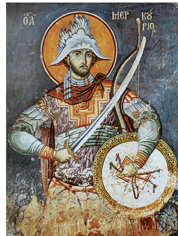
Ο άγιος Μερκούριος, έργο του Μανουήλ Πανσέληνου (τοιχογραφία), Πρωϊάτο, Αγιον Όρος

τιμές, επειδή όμως ξέχασε τον Χριστό, ο άγγελος ήρθε στο όνειρό του και τον επέπληξε. Κατόπιν τούτου, ο Μερκούριος μετενόησε και προσπαθούσε να βρει τρόπο να παραιτηθεί από τα τιμητικά αξιώματα που είχε λάβει. Οι εχθροί του στο μεταξύ τον διέβαλαν στον βασιλιά, ο οποίος κάλεσε τον Μερκούριο για να μάθει την αλήθεια. Ο άγιος ομολόγησε την πίστη του στον Χριστό και αφήρεσε από επάνω του τα στρατιωτικά ενδύματα και τα διακριτικά του βαθμού του. Ο βασιλιάς διέταξε τη φυλάκισή του, όμως μέσα στη φυλακή ο άγγελος εμφανίστηκε και τον εμψύχωσε. Την επομένη, ο Μερκούριος οδηγήθηκε ενώπιον του