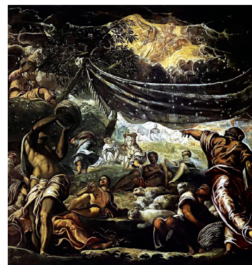
Τιντορέτο, Η συλλογή του μάννα (1577), Scuola Grande di San Rocco, Βενετία

δου απέδσαν το «μαν» ως «μάννα». Σύμφωνα με τη διήγηση του βιβλίου της Εξόδου (κεφ. 16) ο Θεός χορήγησε στους περιπλανώμενους στην έρημο Σιν Ισραηλίτες το μάννα (Εξ 16:31· Αρ 11:6-7· Ψλ 78:24) μαζί με ορτύκια, για να χορτάσει την πείνα τους. Το μάννα ήταν ο άρτος που έδωσε ο Θεός στον λαό του και τα ορτύκια το κρέας, όπως διεμνήνθη στον Μωυσή (Εξ 16:12) και περιγράφεται στο ίδιο βιβλίο ως λεπτή λευκή σκόνη που σκέπασε το στρατόπεδο των Ισραηλιτών, ενώ η γεύση του ήταν παρόμοια με του μελιού. Στη Σοφία Σολομώντος (16:20) αναφέρεται ότι το μάννα είχε την γλυκύτητα του Θεού, γινόταν δηλαδή ανάμνηση της αγάπης, της παντοδυναμίας και της σοφίας του. Ο Ιώσηπος στην Ιουδαϊκή Αρχαιολογία (III, 1,6) περιγράφει το μάννα ως κόκκους κοριάνδρου. Σύμφωνα με την εντολή του Θεού έπρεπε να συλλέγεται το πρωί, επειδή η πλιακή ακτινοβολία το ρευστοποιούσε, και να συγκεντρώνεται σε ποσότητα ανάλογη με την ημερήσια