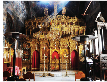
Άγιος Γεώργιος Φανερού, άποψη από το εσωτερικό

να: ΕΤΕ 2002, σ. 210 -212, 223, 271-273, 304, 305. Μπούρας, Χ., «Φλιούς. Παναγία η Ραχιώπισσα», ΔΧΑΕ 16 (1991-1992) 39-46. Ορλάνδος, Α., «Οι ναοί των Ταρσινών και της Λέχοβας», ΑΒΜΕ 1/1 (1935) 95-98. Ορλάνδος, Α., «Βυζαντινοί ναοί της Ανατολικής Κορινθίας, Γ' Μνημεία της προς ΝΑ του Χι-