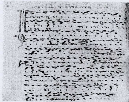
Евнух Филантропинский. Стихира «Ныне пророческое проречение». Матиматарий. Сер. XIV в. ( Athen. Bibl. Nat. 2500. Fol. 100v )

ЕВНУХ ФИЛАНТРОПИНСКИЙ [греч. Εὐνούχος Φιλανθρωπῆνος ], протопсалт, визант. мелург. Его имя встречается в рукописных Матиматариях XIV–XVI вв., а также в каталоге Кирилла Мармаринского, митр. Тиносского, «составленном согласно Иоанну Протопсалту» (т. е. по данным, относящимся к 1734/36–1770), к-рый приводит в своем Теоретиконе (как в рукописи, так и в издании) Хрисанф из Мадита (см.: Χατζηγακουμής Μ. Κ. Αὐτόγραφο (1816) τοῦ «Μεγάλου Θεωρητικοῦ» τοῦ Χρυσάνθου // Ἐρανιστής. 1974. Т. 11. С. 321–322; Χρυσάνθος, ἀρχιεπ. Διπραχίου ὁ ἐκ Μανδύτων. Θεωρητικὸν Μέγα τῆς Μουσικῆς. Τεργέστη, 1832. С. XXXIII–XLIII; крит. изд. Г. Н. Константины: Ἀθήνα, 2007. С. 100–123. ( Βασιλαϊδινὴ Μουσικὴ Βίβλος — Μουσικολογικὰ Μελετῆ-