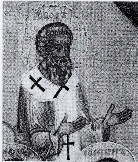
Ап. ЕвѦд. Фрагмент иконы «Апостольские деяния». 1698 г. (частное собрание)

ЕВѦД [Еводий; греч. Εὐδοῦς, Εὐόδιος], ап. от 70, сщмч. (пам. 7 сент. и 4 янв., греч.— 28 апр.), о к-ром нет упоминаний в НЗ. Согласно церковному Преданию, Е. возглавил Ап-